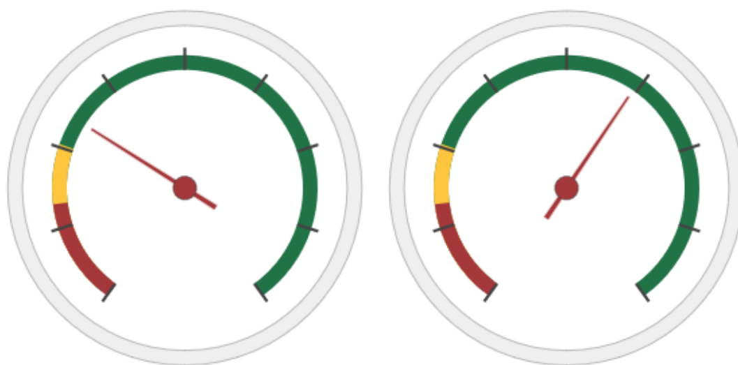
Volumen medio (1980-2015) Volumen máximo (1980-2015)

En la siguiente figura se representan los valores medio (30%) y máximo (62%) alcanzados en la explotación de trasvase (periodo 1980-2015); es significativo que el máximo corresponde al inicio del periodo y no se ha superado en los más de 35 años de explotación del trasvase.