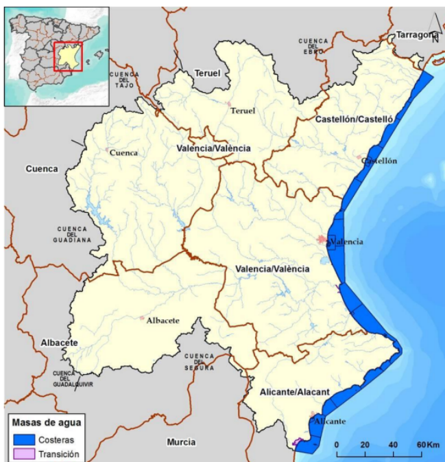
Figura 1. Ámbito territorial de la Demarcación Hidrográfica del Júcar.

Para ilustrar la situación, a continuación se muestran dos figuras tomadas de la Memoria del Plan hidrológico del Júcar (ciclo 2016-2021) , con el territorio de la demarcación dividido por ámbitos provinciales y por sistemas de explotación: