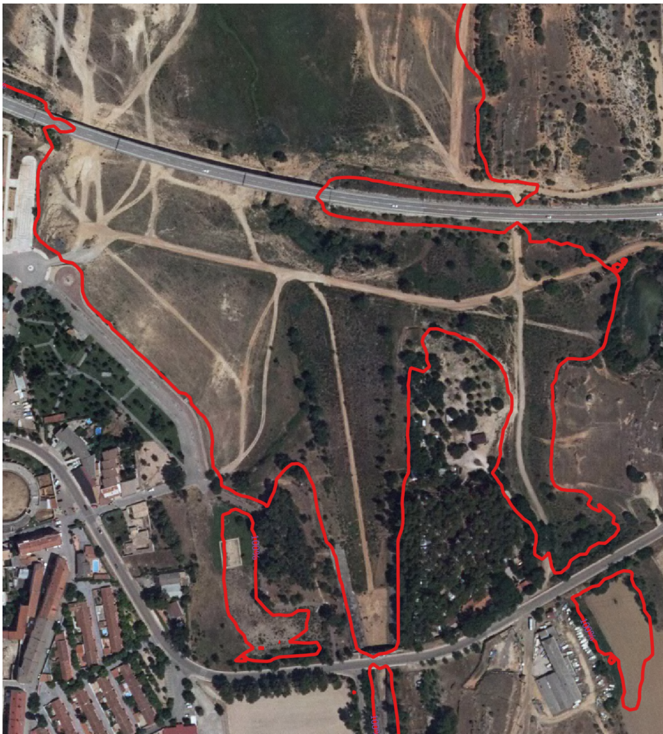
Vista aérea del paseo marítimo de Sacedón y de la embocadura del túnel de conexión con Buendía. En rojo, el máximo nivel

del «paseo marítimo» de Sacedón. A su vez, las embarcaciones se encuentran apelotonadas. También es de remarcar que en este punto sale el túnel que conecta el embalse de Entrepeñas con el de Buendía, con una red formada de caminos y una vegetación arbustiva y arbórea en el vaso del embalse, signo de que hace décadas que por ahí no ha llegado el agua.