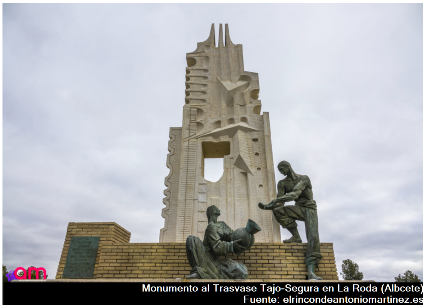
Monumento al Traspase Tajo-Segura en La Roda (Albcete)

Quizás me digas, lector amigo, que esto del monumento a la cruz de San Andres es muy fuerte. Pero, verás, resulta que precisamente en Castilla la Nueva (que ahora llamamos Castilla-La Mancha), en el municipio albaceteño de La Roda, existe precisamente un monumento al Traspase Tajo-Segura, versión moderna de los canales del proyectista al que se refiere José Cadalso.