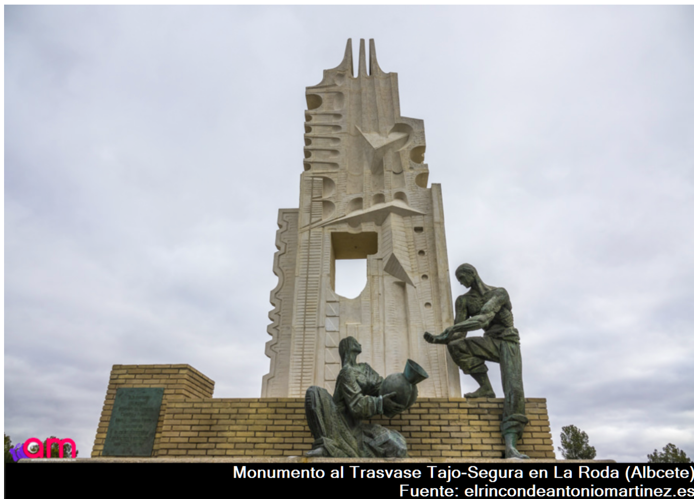
Monumento al Traspase Tajo-Segura en La Roda (Albcete)

Quizás me digas, lector amigo, que esto del monumento a la cruz de San Andres es muy fuerte. Pero, verás, resulta que precisamente en Castilla la Nueva (que ahora llamamos Castilla-La Mancha), en el municipio albaceteño de La Roda, existe precisamente un monumento al Traspase Tajo-Segura, versión moderna de los canales del proyectista al que se refiere José Cadalso.