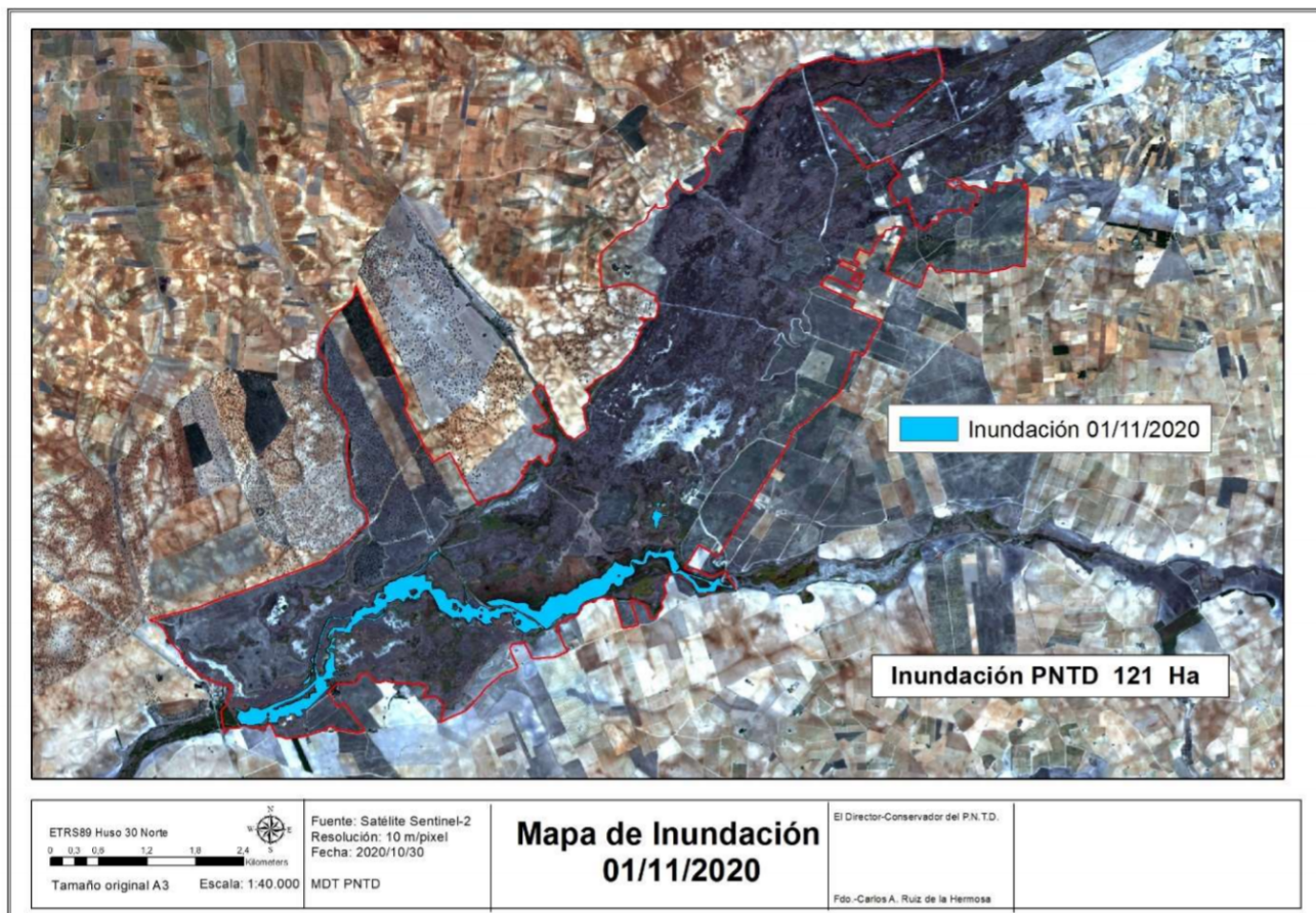
Figura 13. Imagen de la zona inundada del Parque Nacional de las Tablas de Daimiel (1 de noviembre de 2020).